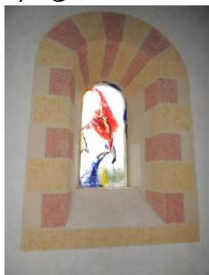
Diennes-Aubigny, église Saint-Pierre Saint-Paul