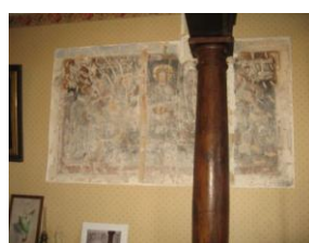
Château de La Bussière