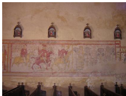
Verneuil, église Saint-Laurent