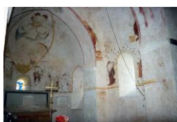
Montaron, église Notre-Dame de L'Assomption